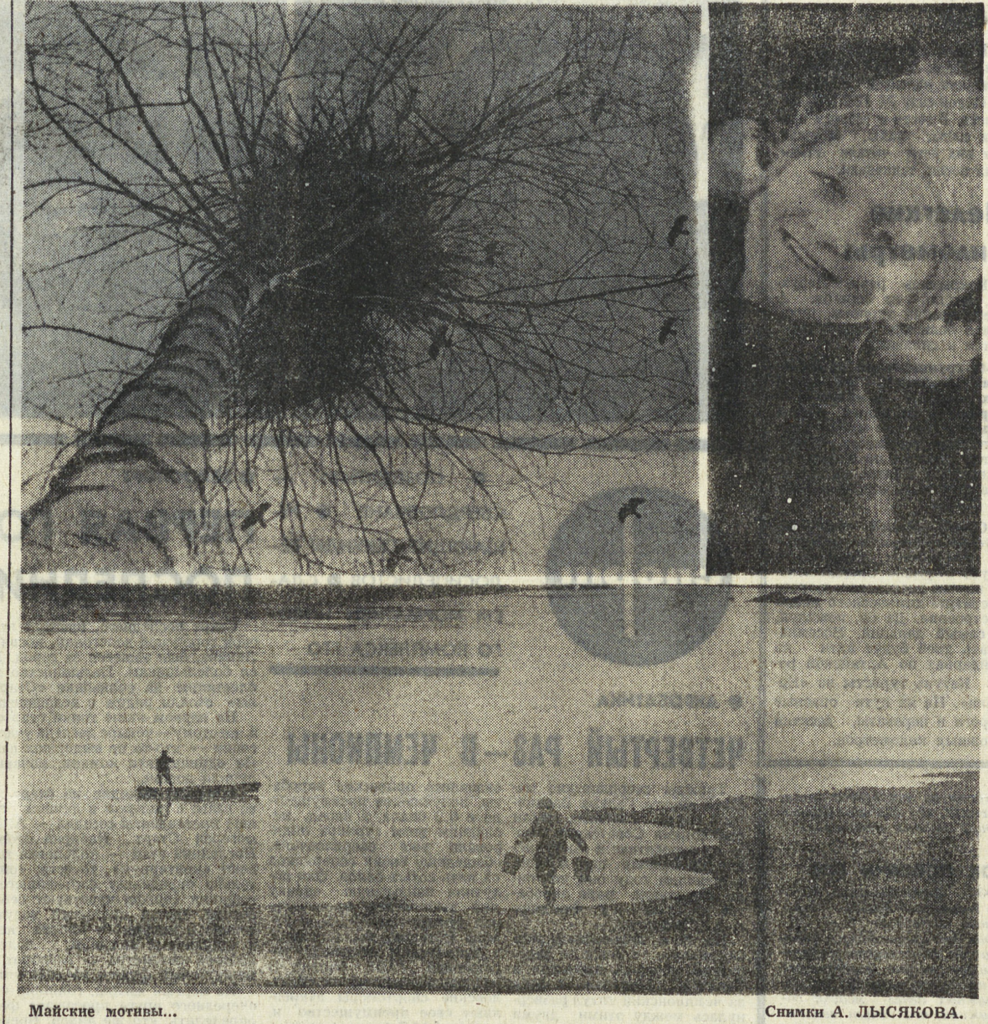
Майские мотивы...