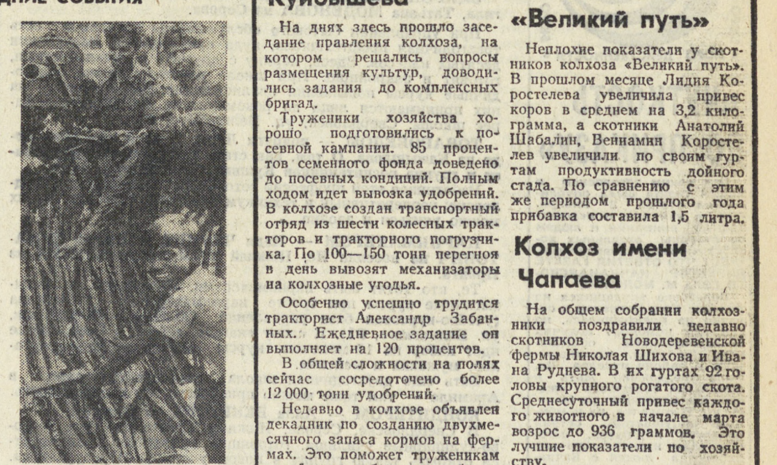
Народная Республика Бангладеш. В Дакке состоялась церемония сдачи оружия партизанами подразделениями Коммунистической партии, национальной народной партии и студенческого союза. На снимке: во время сдачи оружия.

Нью-Йорк. «Союз молодежи рабочих за освобождение» — марксистско-ленинское объединение американской молодежи, созданное два года назад, — активно готовится ко второму съезду, который будет проходить в Чикаго с 28 апреля по 1 мая. Сейчас во всех местных организациях союза, которые соз-