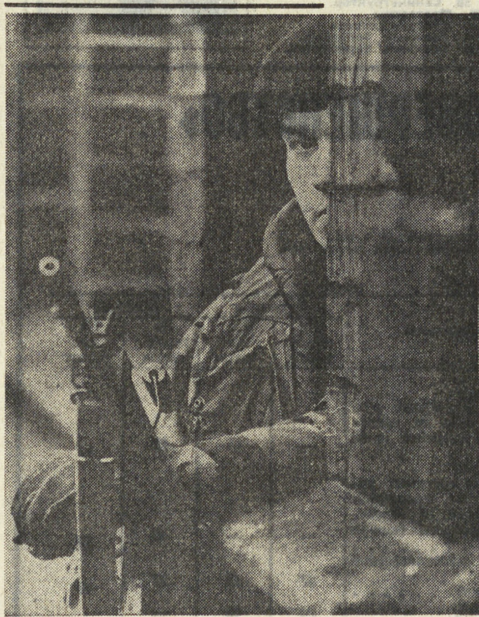
Это грозные будни Белфаста — столицы Северной Ирландии. Огнем и свинцом английские оккупационные войска пытаются подавить движение протеста против политической репрессии и промывала, проводимой консервативным правительством Лондона. За шесть месяцев со времени введения в действие закона о трудовых заключенных, уже арестовано 2387 человек без суда и следствия, на счету оккупантов более 150 убитых, сотни раненых. Наиболее «отличившиеся» в расправе над борцами за гражданские права английское правительство отменило наградами. Не он ли один из них?

С интересными, разнообразными программами — из народных песен, произведений советских и зарубежных композиторов, хоровой классики — выступили детский хор областной школы-интерната № 1 (руководитель Ю. Ус), народная хоровая капелла Уралаганзава из Нижнего Тагила (рук. А. Файбунович), народный ансамбль песни и танца ДК «Строитель» из Асбеста (рук. А. Богомолов), хор студентов факультета Свердловского педагогического института (рук. заслуженный работник культуры РСФСР М. Рожанский), хор музыкального училища имени Чайковского (рук. Н. Голованова) и народный ансамбль песни и танца ДК «Юность» из Каменика-Уральского (рук. А. Устинов). Самостоятельно высокое исполнительское мастерство, подлинную любовь к песне, хоршее чувство ансамбля, пронизываемое в суть хорового музыкального произведения.