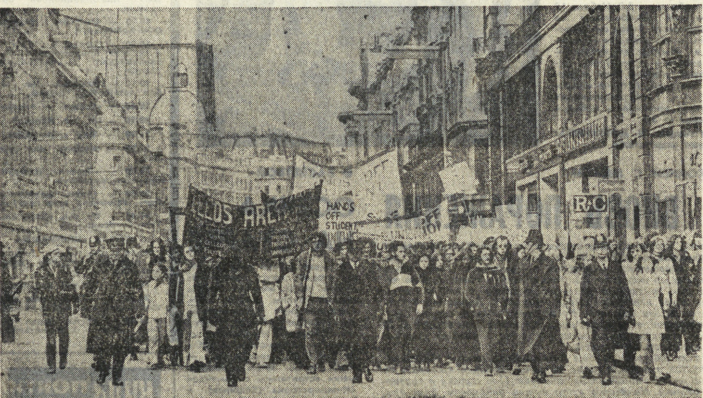
ЛОНДОН. Массовая демонстрация английских студентов против посягательства правительства консерваторов на финансовые средства студенческих союзов. Одновременно участники этого грандиозного марша выразили солидарность с бастующими шахтерами.

На повестке дня — общеевропейское совещание Провокации сионистов • Протестуют студенты