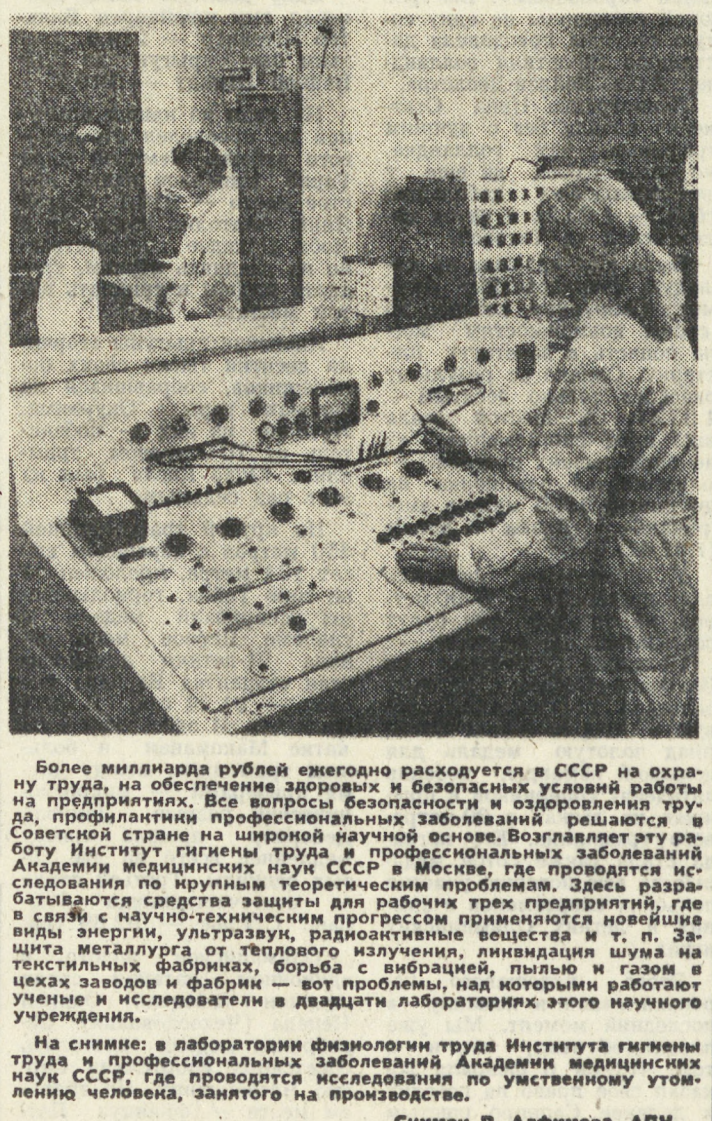
Более миллиарда рублей ежегодно расходуется в СССР на охрану труда, на обеспечение здоровых и безопасных условий работы предприятий. Все вопросы профессиональной безопасности и оздоровления труда, профилактики профессиональных заболеваний решаются в Советской стране на широкой научной основе. Возглавляет эту работу Институт гигиены труда и профессиональных заболеваний Академии медицинских наук СССР в Москве, где проводится исследование по крупным теоретическим проблемам. Здесь разрабатываются средства защиты для рабочих трех предприятий, где в текстильных фабриках, в связи с научно-техническим прогрессом применяются новейшие виды энергии, ультразвуку, радиоактивные вещества и т. п. Защита металлургов от теплового излучения, лифтовых шумов в цехах заводов и фабрик — вот проблемы, над которыми работают ученые и исследователи в двадцати лабораториях этого научного учреждения. На снимке: в лаборатории физиологии труда Института гигиены труда и профессиональных заболеваний Академии медицинских наук СССР, где проводится исследование по утомлению утомленного человека, занятого на производстве.