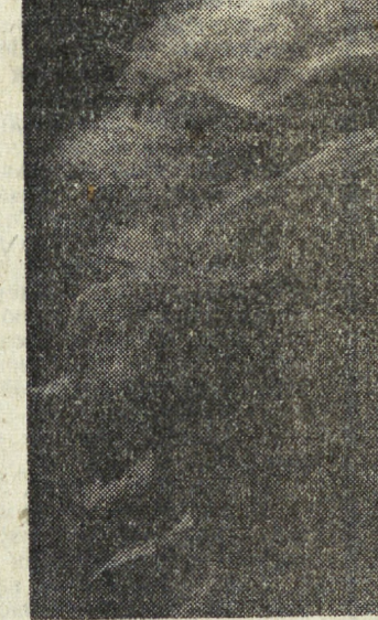
В. КОРОТКОВ «В строю», А. ЧИКИШЕВ «Портрет», Л. МОЧАЛОВ «Кияжи».