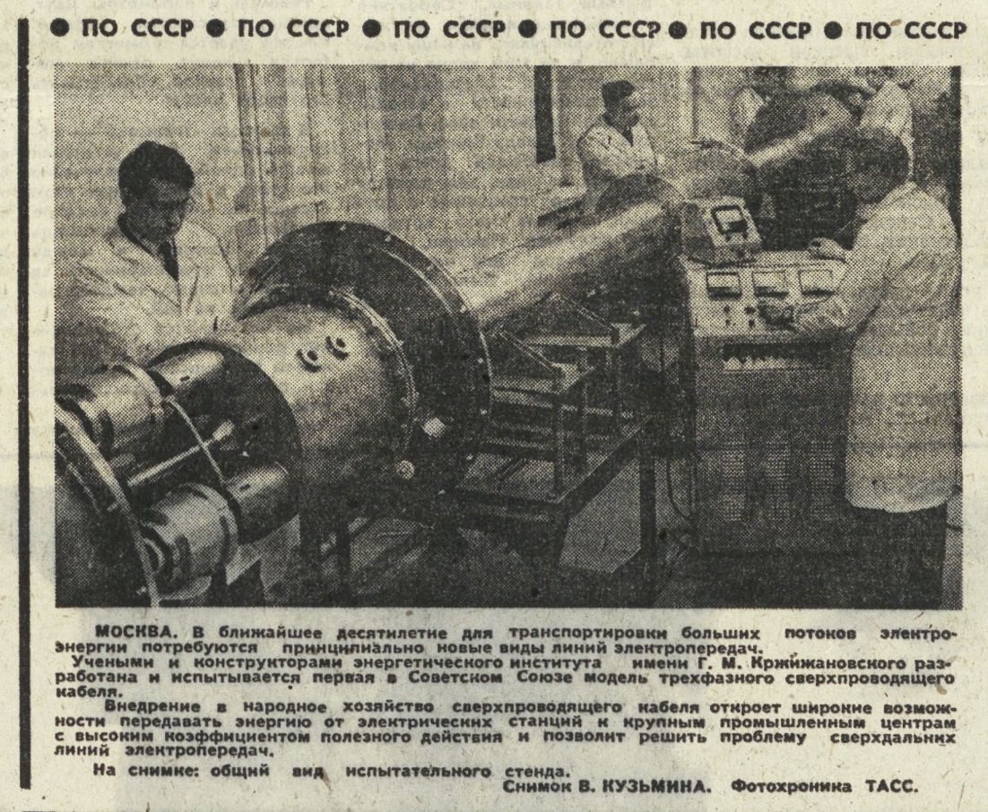
МОСКВА. В ближайшее десятилетие для транспортировки больших потоков электроэнергии потребуются принципиально новые виды линий электропередач. Учеными и конструкторами энергетического института имени Г. М. Кржижановского разработана и испытывается первая в Советском Союзе модель трехфазного сверхпроводящего кабеля. Внедрение в народное хозяйство сверхпроводящего кабеля откроет широкие возможности передавать энергию от электрических станций к крупным промышленным центрам с высоким коэффициентом полезного действия и позволит решить проблему сверхдлинных линий электропередач. На снимке: общий вид испытательного стенда.