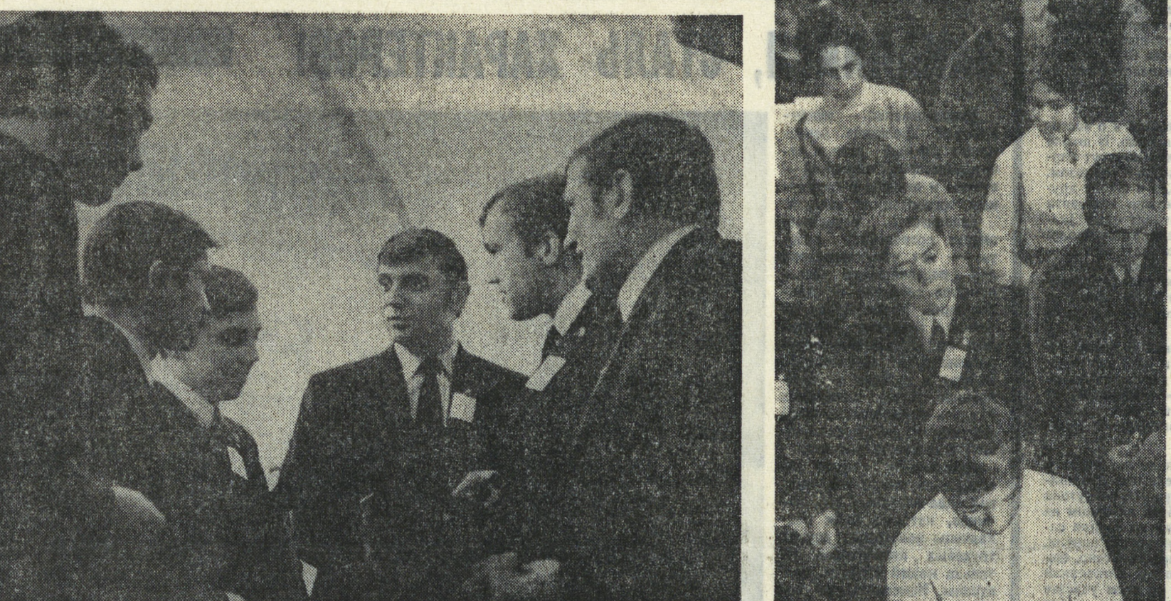
Есть о чем поговорить делегатам и гостям конференции — представителю Новокаменского машиностроительного и Ижорского им. Жданова заводов и Волжского автозавода (справа); идет конференция.