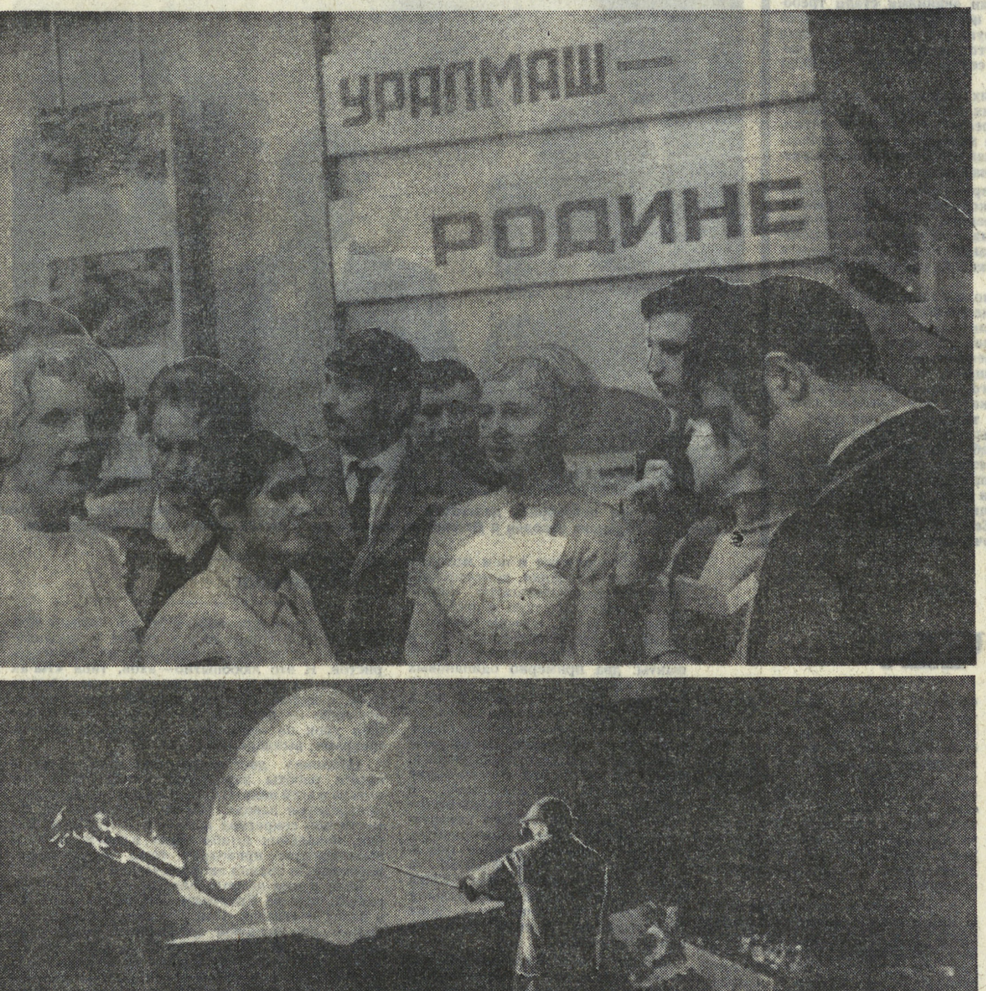
Читайте 2-ю страницу.

НА СНИМКАХ: группа делегатов конференции от комсомольской организации цеха сборки буровых машин и экскаваторов; в сталелитейном цехе идет плавка.