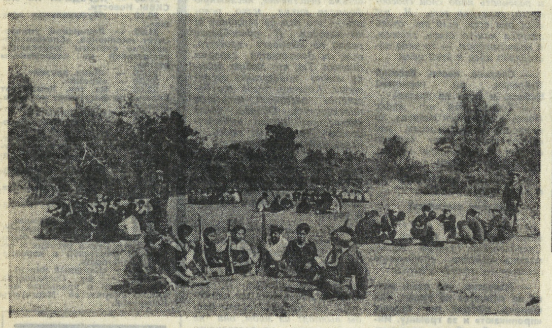
Этот снимок сделан в одном из освобожденных районов Лаоса. Под руководством опытных инструкторов ВИА-ТАСС.