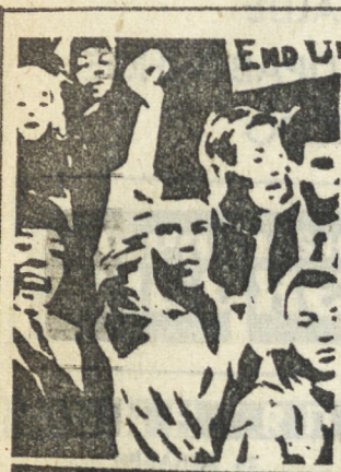
ОНОСТЬ ОБЛИЧАЕТ ИМПЕРИАЛИЗМ!

США расходуют около 500 млн. долларов в год на религиозные диверсии в странах социализма.