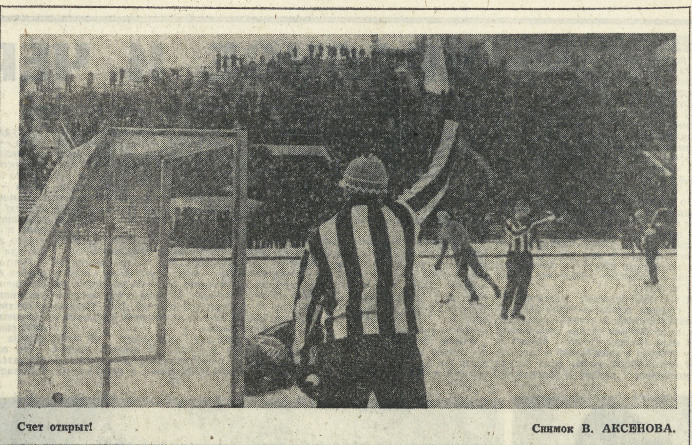
Счет открыл!