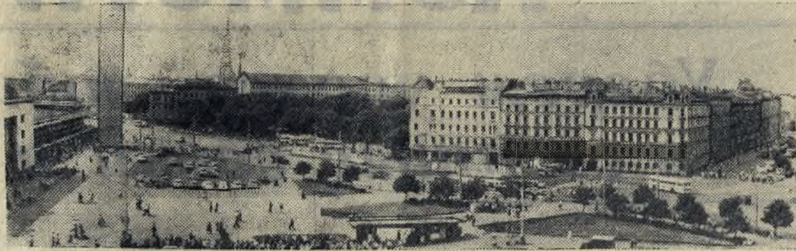
Столица Латвийской ССР — Рига. Привокзальная площадь. Фото Е. Фадеева (Фотохроника ТАСС).

(Из Постановления ЦК КПСС «О подготовке к 50-летию образования СССР»).