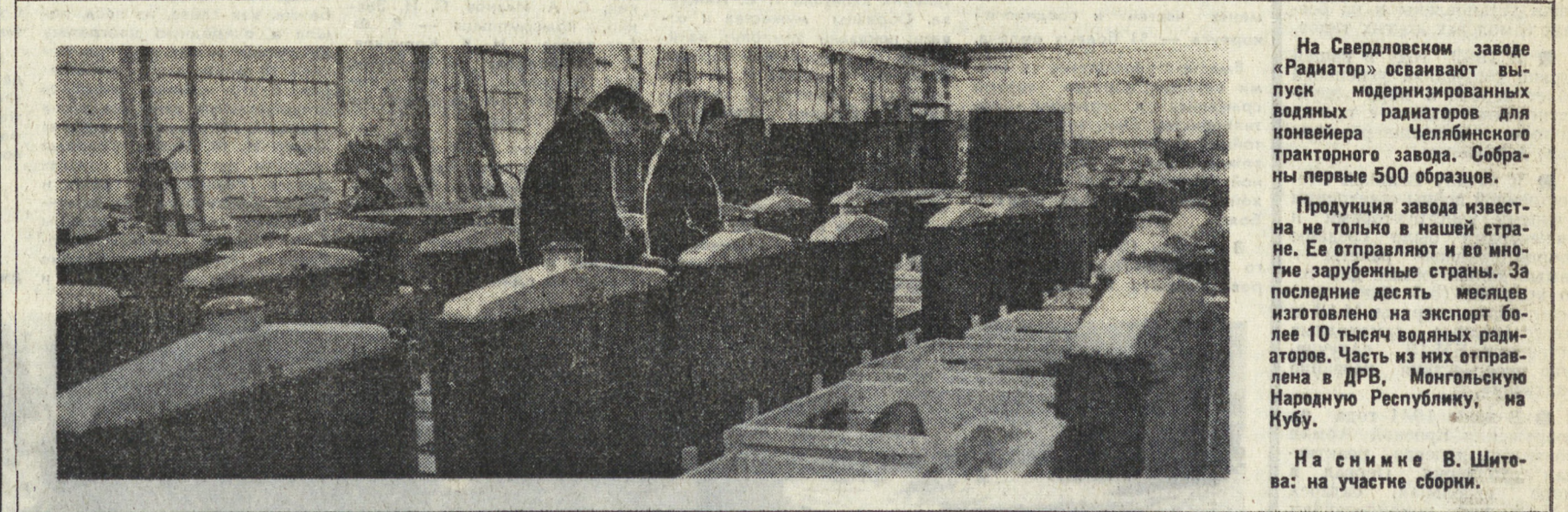
На Свердловском заводе «Радитор» осваивают выпуск модернизированных водных радиаторов для новобера Челябинского тракторного завода. Собраны первые 500 образцов.