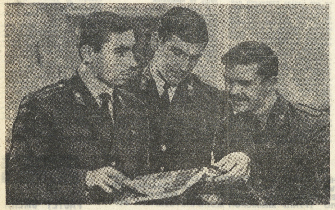
На снимке: группа курсантов-отличников учебного пункта УВД, награжденных почетными грамотами Свердловского обкома ВЛКСМ и памятными подарками.

ДВА ГОДА назад он вышел из учеников и теперь жил размеренно, спокойной жизнью. Работал только в первую смену, что его устраивало, вечера у него были свободны. Тратил он их, как хотел. Любил посидеть с друзьями за кружкой пива, ходил в кино, иногда читал, редко. Времени пролетало незаметно. День за днем одно и то же: работа, свободный вечер, опять работа.