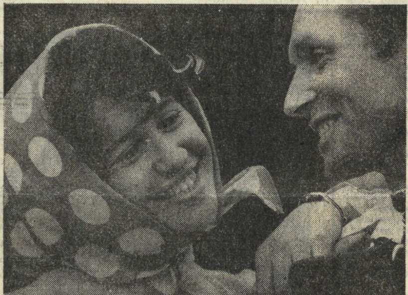
Дни осенней страды. Они всегда памяты для каждого сельского труженика своим напряженным ритмом, которому подчинены не только механизаторы, но и овощеводы, работники ферм. И праздник урожая — это праздник имени хлеба...