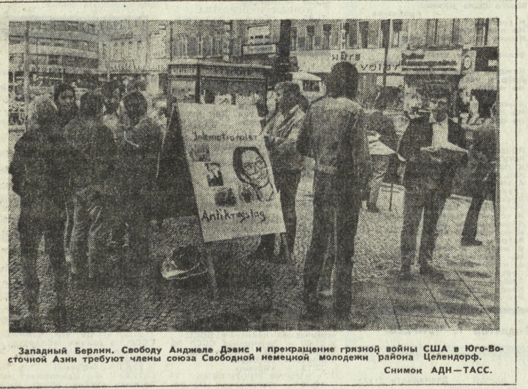
Западный Берлин. Свободу Анджеле Дэвис и прекращение грязной войны США в Юго-Восточной Азии требуют члены союза Свободной немецкой молодежи района Целендорф.

Однако Соединенные Штаты до сих пор не отошли от своей мирной инициативы южновьетнамских патриотов. В планах Вашингтона — по-прежнему ориентация на дальнейшую затяжку войны. Чуть и на сей раз удержаться в президентском кресле, Тхуеу протаял выгодный для себя «закон о выборах», фактически устраивая от предвыборной борьбы оппозиционных кандидатов. Он назначил на посты начальников провинций и военных округов своих единомышленников, отдалил репрессивную военно-полицейскую машину, создал террористические организации и тайную агентуру для подавления инакомыслия. Сейчас, как свидетельствуют многие сообщения из Сайгона, Тхуеу готовит новую политическую аферу. Фальшивый характер предстоящих «выборов» настолько очевиден, что это вынуждено признать даже печать США. Американская марионетка сделала все возможное, чтобы остаться кандидатом в единственный число. С. АФОНИН, В. ШУМЕЕВ. (АПН).