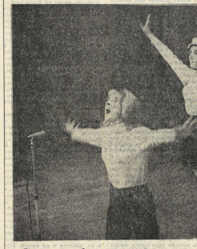
Свердловские любители искусства в этом сезоне познакомились с творчеством еще одного театра Москвы — драматическим театром на Таганке. Фрагменты из постановок, которые показала московские гости, с большим интересом были приняты свердловчанами. НА СНИМКЕ: сцена из выступления театра на Таганке.