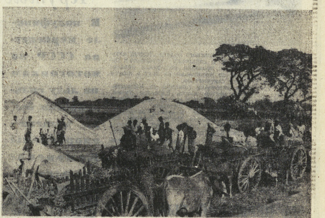
Бирма. Рис — хлеб бирманцев. Он является не только главным продуктом питания, но и основной статьей бирманского экспорта.

В цехах часто можно было увидеть фронтовиков-танкистов. Они приезжали сюда экипажами со всех фронтов — за новыми танками.