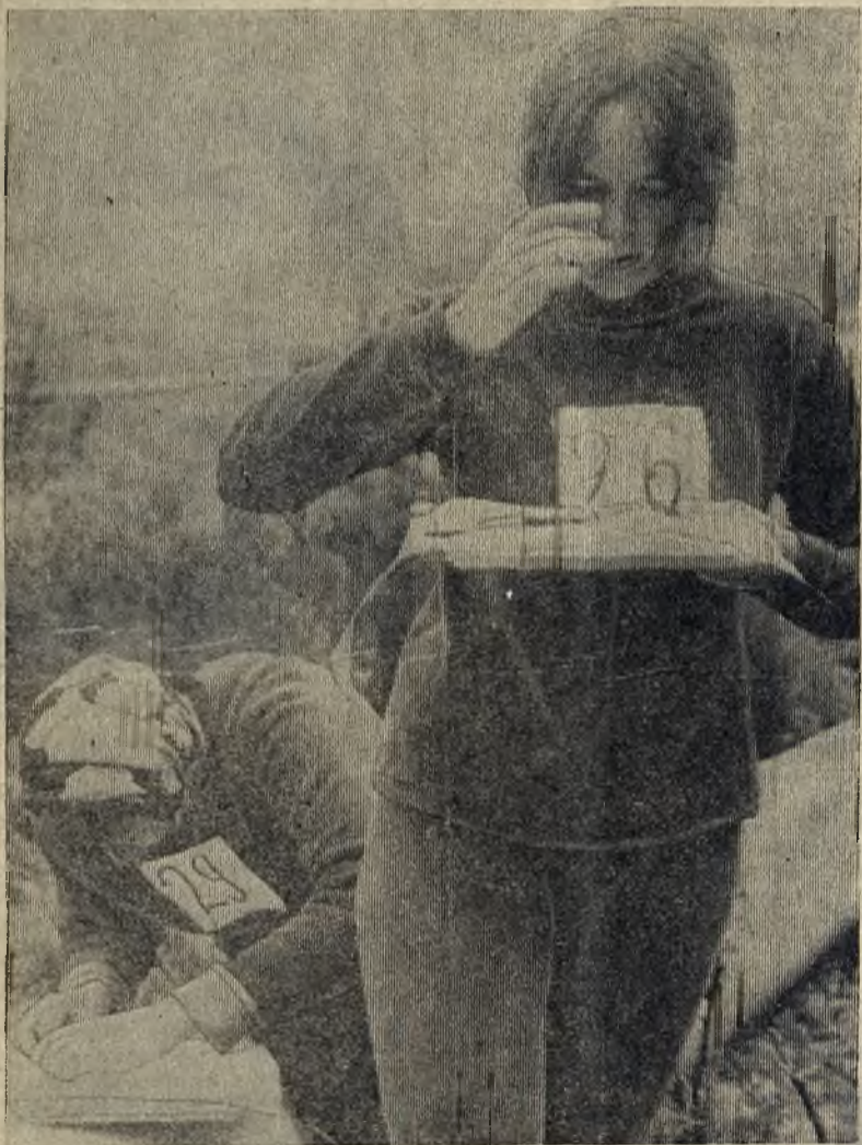
По азимуту.

На хорошем, веселом месте расположился дом тружеников