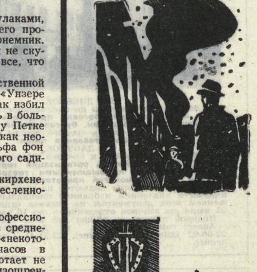
Страницы документальной книги о советских разведчиках

странную документальную книгу Андреса Саракина «Макс Клаузен радирует из Токио».