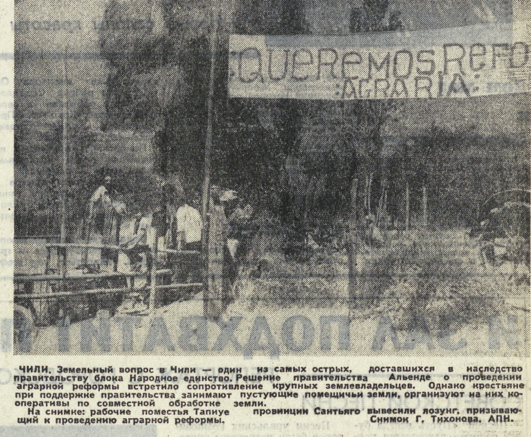
Чили. Земельный вопрос в Чили — один из самых острых, доставшихся в наследство правительству блока Народное единство. Решение аграрной реформы встретило сопротивление крупных землевладельцев. Однако крестьяне при поддержке правительства занимают пустующие помещичьи земли, организуют на них кооперативы по совместной обработке земли. На снимке: рабочие поместья Талипе провинции Сантьяго вывезли лозунг, призывающий к проведению аграрной реформы.