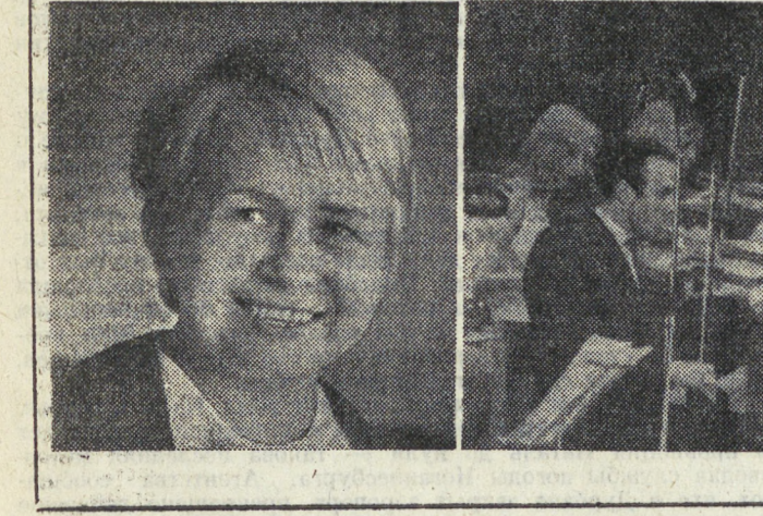
В. Баберева «Мальчишка»