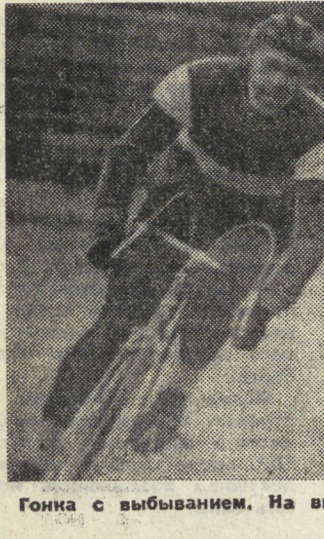
Гонка с выбыванием. На вырыве...