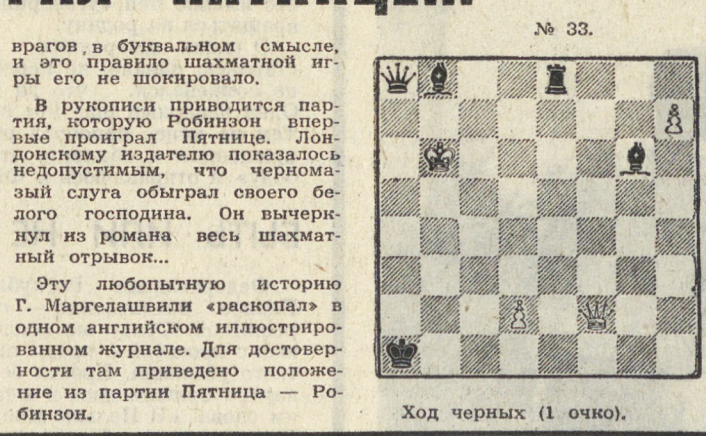
Ход черных (1 очко).

Английские литературоведы разбирая рукописи Даниэля Дефо, обнаружили отрывок из его знаменитого романа, не вошедший ни в одно из многочисленных изданий. Это рассказ о том, как Робинзон в долгие месяцы тропических дождей отменялся в своей хижине, выделен из красной и желтой глины шахматные фигуры и бегал их на огне. На маленьком полу пещеры была высечена шахматная доска. Абориген острова Пятница оказался способным учеником. Он быстро постиг премудрости шахмат. Ему, правда, трудно было уразуметь, что это за фигура — конь. Лошадь на