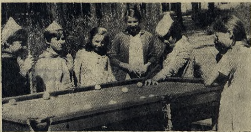
В ПИОНЕРСКОМ ЛАГЕРЕ «МЕТАЛЛУРГ».

ваются на достигнутом: готовится единая парадная форма для всех пионеров, строятся планы дальнейшего совершенствования лагеря. Только обладая безграничным чувством нежности к детям, ответственности, можно построить такой лагерь, обставить корпус современной, удобной и практичной мебелью, отдать все лучшее детям. Пионерскому лагерю «Металлург» не