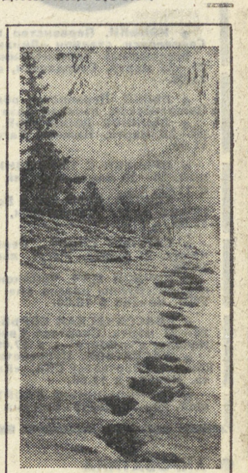
Последние следы.