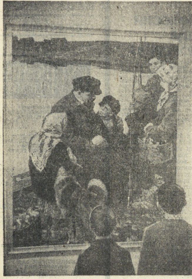
ЛЕНИНГРАД. В залах Русского музея открылась юбилейная выставка произведений ленинградских художников...