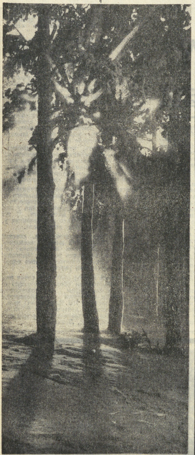
Утро в основном лесу.