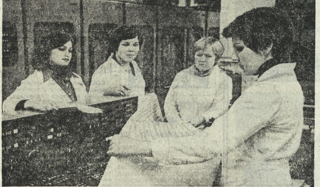
Регулярно проводят рейды члены «Комсомольского прожектора» Свердловского кузцового вычислительного центра Министрства автомобильного транспорта...