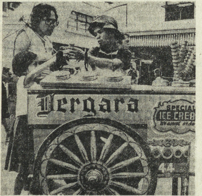
ФИЛИППИНЫ. На с н и м к е: продавец мороженого.

Сегодня четыре объединения более 4,5 миллиона членов. Самые 65 тысяч его первичных организаций действуют на промышленных предприятиях, в учреждениях и учебных заведениях, на селе.