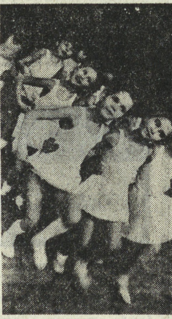
Терный танец. И ответственность больше. Знаете, уже надо читать себя в мире искусства — можно так сказать? Я очень люблю балет и мечтаю стать профессиональной танцовщицей.

Мальчик плакал, стоя перед закрытой дверью музыкального класса. — Что с тобой случилось? — Пришел «на музыку», а оказалось — надо играть, а я очень расстроился! — Но я же так хотел заниматься!