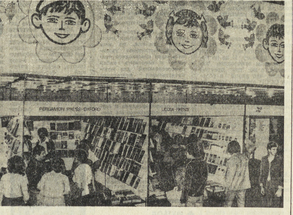
БОЛГАРИЯ. XII Международная книжная выставка в Софии. Ее девиз «Книга на службе мира и прогресса».

Международные Заметки «военной угрозы», утвердилось на заседании кабинета министров «Белую книгу» по вопросам обороны на 1979 год.