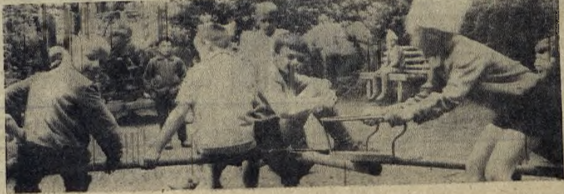
На детской площадке.