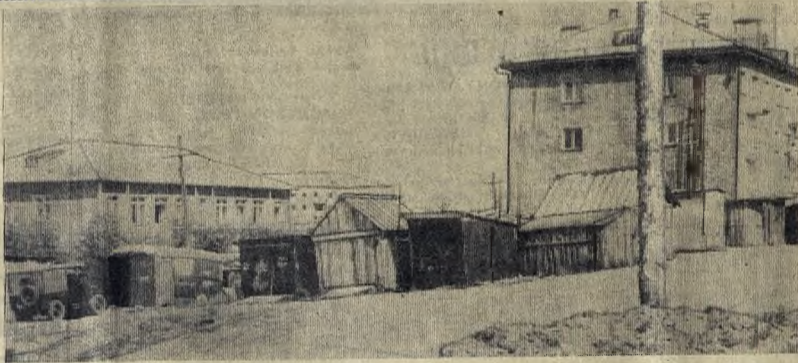
△ В горкоме КПСС

Вот как это выглядит на нашем снимке, который сделан в районе Гавани.