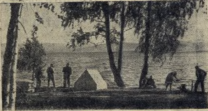
Свердловская область. Озеро Иткуль — одно из красивейших на Урале, излюбленное место отдыха жителей области. На снимке: рабочие Полевского леспромхоза на берегу Иткуля.