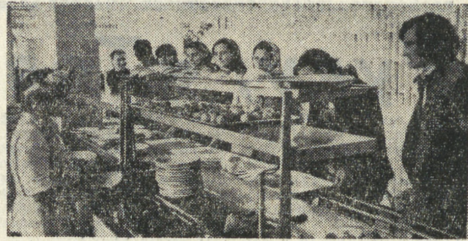
В столовых Верхней Салды проходит месячник качества приготовления блюд под девизом «Дары золотой осени». Активное участие в месячнике принимает молодежь.

Большой интерес вызвали занимательная игровая программа дипломанта Всесоюзного смотра массовиков И. Симонова, «Открытый микрорайон» с комментариями С. Демьяненко. К. ИВАНОВ.