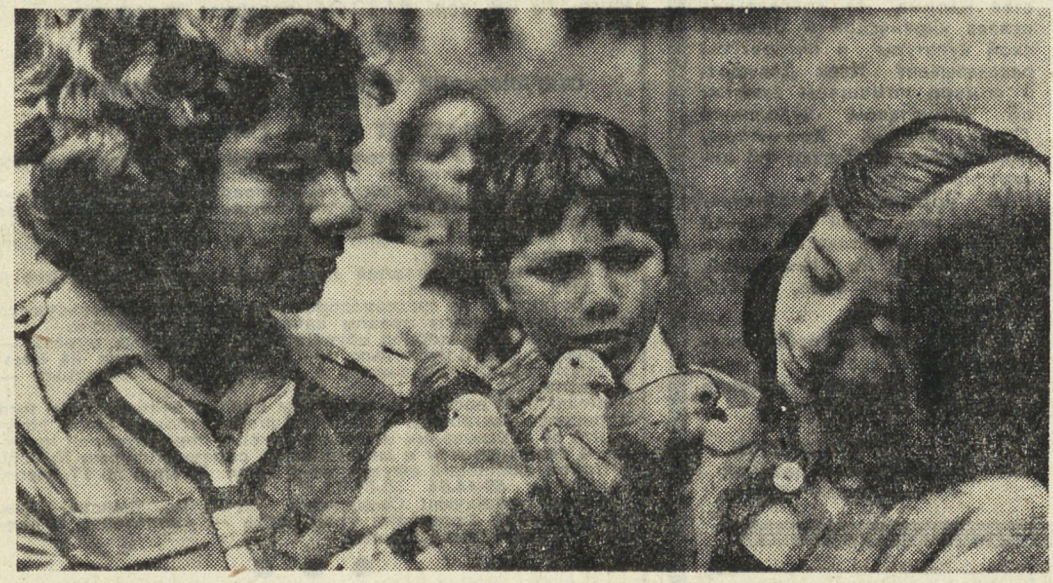
7 октября Германской Демократической Республики исполнилось 30 лет. Сотни ребят из государств четырех континентов, в том числе из Советского Союза, отдохнули этим летом в крупнейшем международном детском лагере ГДР — «Пионер» республике имени Вильгельма Пика, находящемся под Берлином. На снимке: дети Чили в лагере.

здесь в другом — все мероприятия клуба подчинены строго продуманной системе. Они, мероприятия, не ЦУ, спущенные ученикам сверху, а плод фантазии, энтузиазма самих членов КИДа. Вот что главное — в «Товарище», и, к счастью, не умеют работать формально. КИД — клуб. Коллектив. Компания. Значит, какая-то общность людей, объединенных вокруг определенного интереса. А компания, и тем более компания творческая, быстра на выдумки. КИД «Товарищ» ставит спектакли по произведениям зарубежных авторов — для расширения кругозора (и своего, и одноклассников). А вечера, посвященные красным датам международного календаря, инспирируются так, что зрителю начинает казаться, что он не в Верхней Салде, а, допустим, в Чили. Или во Вьетнаме. С большим успехом прошел вечер, посвященный памяти жертвам фашизма. «Товарищ» молод. У него еще все вперед. В училище будут меняться поколения учащихся, но традиции, заложенные сейчас, хочется верить, будут жить долго. В. СЫРЦОВ, методист Свердловского Дворца молодежи, Верхняя Салда.