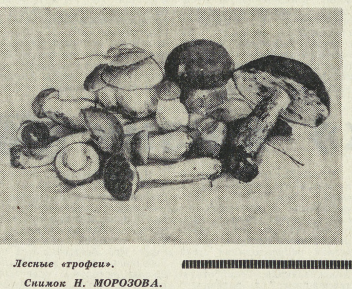
Лесные «строфы».

пользующихся успехом у свердловчан. Среди них — «Натанша Ростова», «Сердце в маршале», «Золотой ключик», «Бемби», «Нежданные гости».