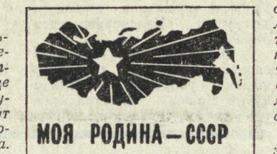
МОЯ РОДИНА - СССР

ПОШКАР-ОЛА. Специально для ребят предназначен передвижной кинотеатр «Солнышко», созданный в столице Марийской АССР. Он оборудован в троллейбусе, маршрут которого пролегал рядом со многими детскими садами города. В репертуаре кинотеатра — сказки, мультфильмы. «Солнышко» — первый в автономной республике кинотеатр такого рода.