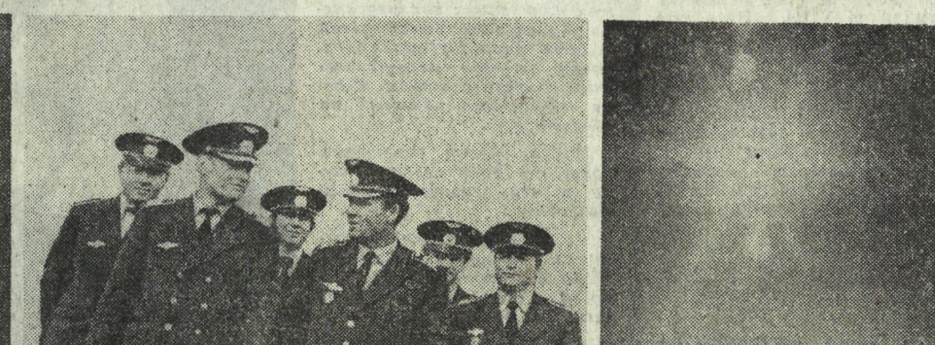
Не только геологам, буровикам, нефтяникам, но и многим другим работникам народного хозяйства не обойтись в наши дни без авиации.