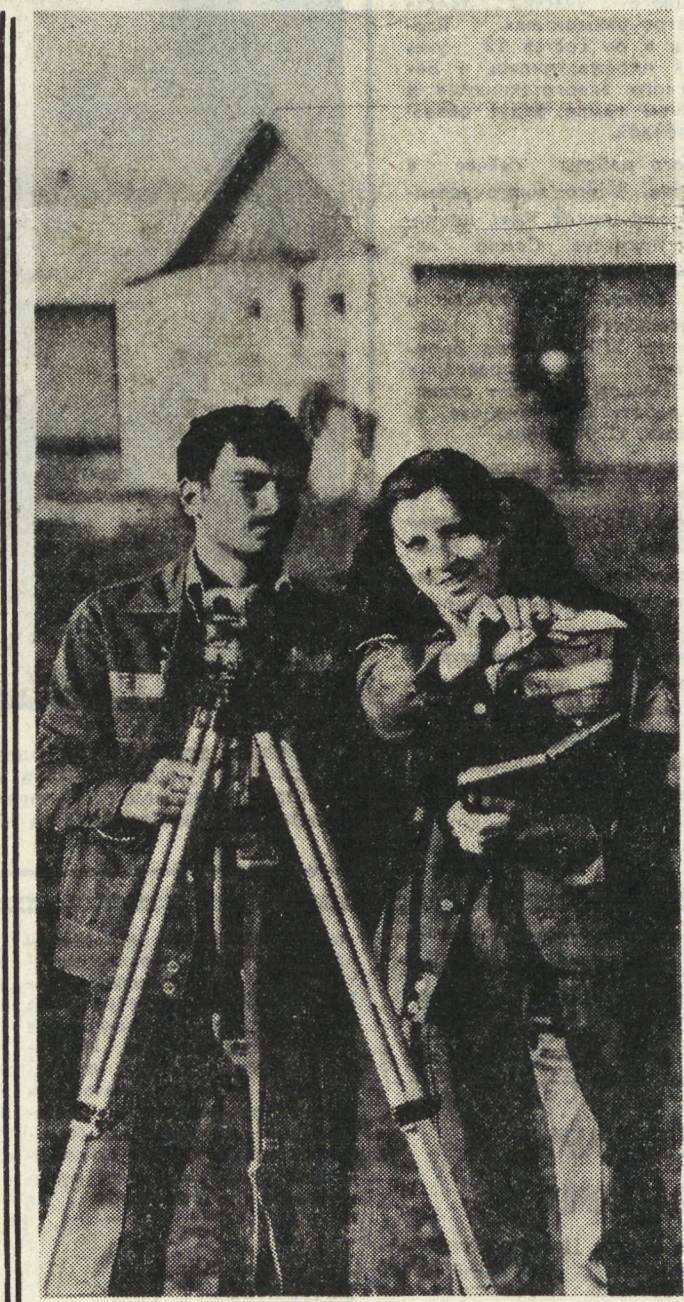
Отряды студентов Ставрополя проводят трудовой семестр на строительных площадках Северо-Кавказской области. В зданиях создаются жилые дома, детские сады и ясли, жилые дома, животноводческие помещения.