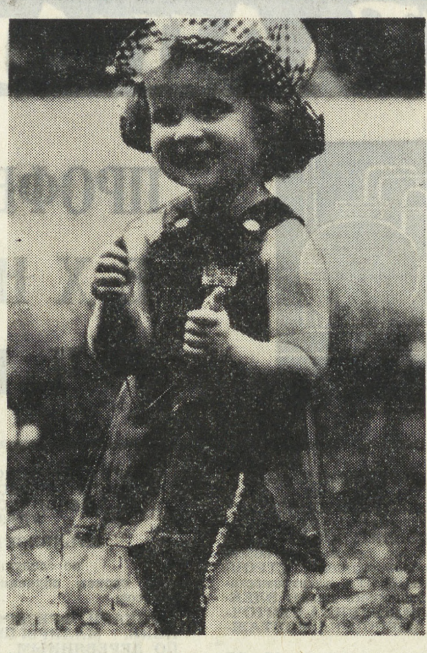
Счастливые дети (Чехословакия).