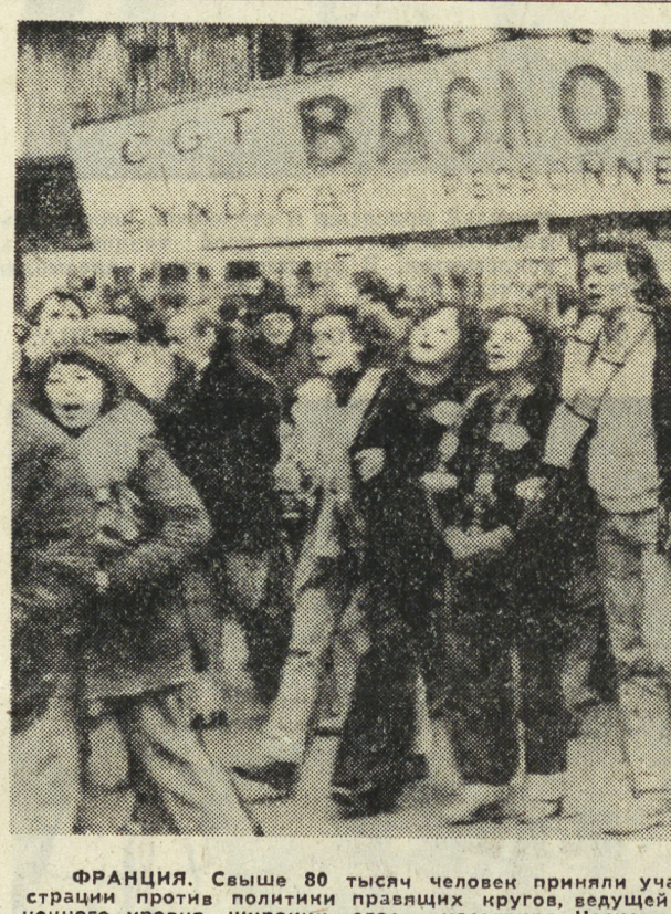
ФРАНЦИЯ. Свыше 80 тысяч человек приняли участие в состоявшейся в Париже демонстрации против политики правых кругов...

Несмотря на свой сравнительно скромный экономический потенциал, Израиль становится одним из крупнейших поставщиков оружия в мире. По данным американской разведки, пишет ведущий канадский журнал «Маклин», доходы Израиля от экспорта оружия за последние пять лет удвоились и в нынешнем году превысят миллиард долларов.