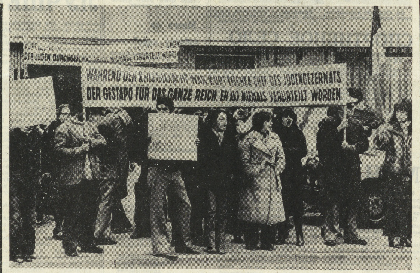
ФРГ. Антифашистская демонстрация по случаю 40-й годовщины погромов, устроенных нацистами в ряде крупнейших городов, состоялась в Кельне.

Изделия ткачей из области Ясы славятся не только в Румынии, но и в соседних странах. Особенно большим спросом у зарубежных покупателей пользуются ковры ручной работы.