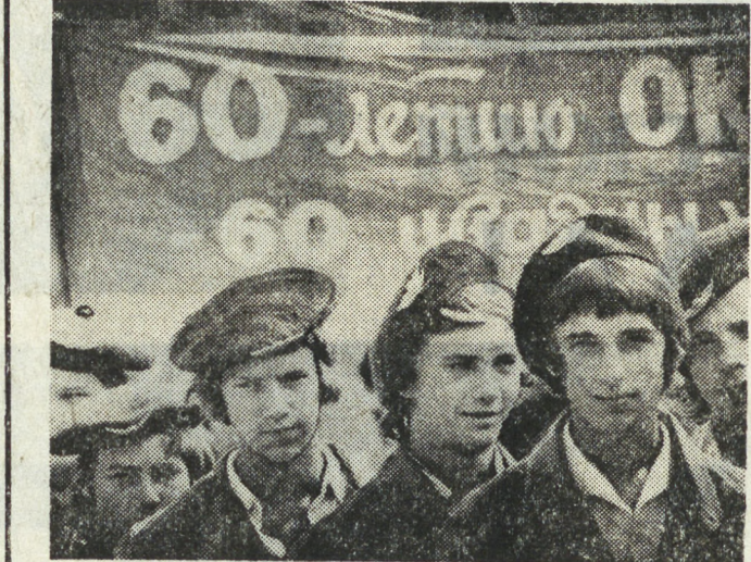
С площади 1905 года каждое лето уходит отряды свердловских студентов-строителей и учащиеся ГПТУ на мирный подвиг.