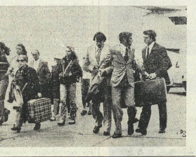
На снимках: кадры из фильмов «Право первой подписи» и «Лекарство против страха» (слева).