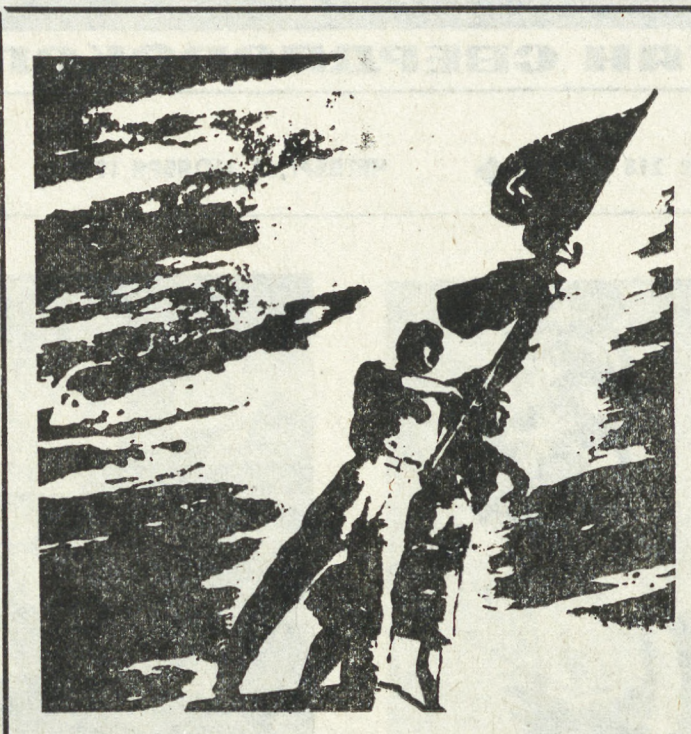
Комсомол Урала — вперед!