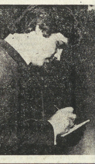
Постал картину режиссер В. Чеботарев на счету которого...