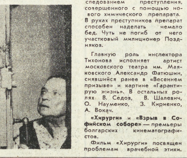
На снимках: кадры из фильмов «Право первой подписи» и «Лекарство против страха» (слева).