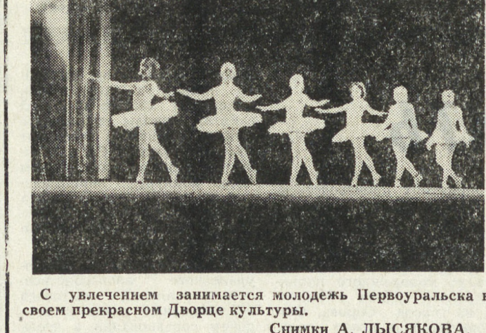
С увлечением занимается молодежь Первоуральска в своем прекрасном Дворце культуры.