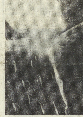
большой, поленом для всей страны деле.

А потом было самое волнующее событие дня. Плавка пионерского лома — праздник труда, праздник металла. Достоверно было ее провести пед-