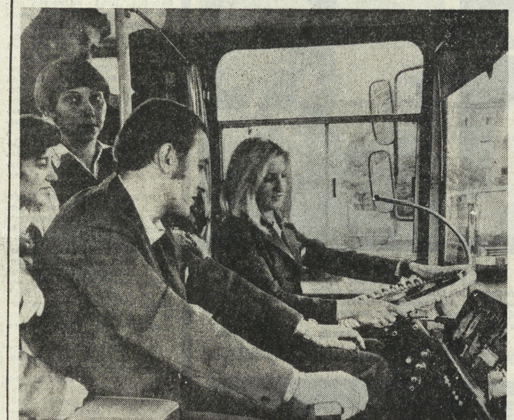
ВНР. Транспортная служба Будвешета открыла для женщин четырехмесячные курсы водителей автобуса...