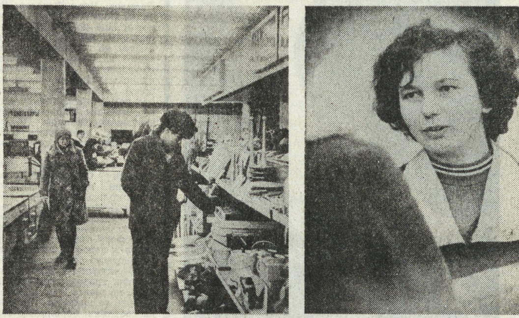
Имя молодого человека, о котором идет речь в статье...

Все мощности новой очереди комплекса намечено освоить полностью в четвертом квартале. (Корр. ТАСС).