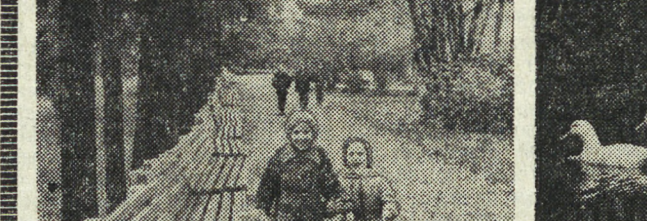
...Листья прощуются с деревьями. В последнюю прогулку перед отлетом в дальний теплый край отравились по осенней воде уток. Вспоминают шепот и смех влюбленных опустевших скамеек. И только двое малышей беззаботно идут по грунтовой осенней аллее. Им весело смотреть на пестрые листья, на белых уток, на холодный пруд. Они еще не знают, что позз назвали осень «унылой порой», и неугомонные детские ножки крепко впечатывают в песок «багрец и золото» листопада...

В этом году будет выпущено 21 тысяча пар туфель.