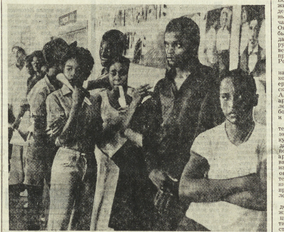
США. У этих молодых жителей Вашингтона день начинается с очередного обхода бирж труда. Все они согласны на любую работу, лишь бы заработать на пропитание. Однако общество равнодушно не гарантирует американцам одно из основных гражданских прав — право на труд. Все глубже погружающаяся в пучину кризиса экономика США не в состоянии обеспечить «лишним людям» рабочие места.

ный процесс, — сказал мне председатель Африканского национального конгресса Южно Африки (АНК) Марк Чоппе. Как грибы из-под земли появляются бесчисленные организации, группы и группы, претендующие на какую-то роль в будущей политической структуре. В годы освободительной борьбы о них никто и не слышал. Сегодня с их помощью южноафриканская администрация хотела бы размыть влияние и авторитет СВАПО. Деятельность внезапно возникших из небытия на политической сцене группировки направлена на возрождение расизма в новой форме. Я имею в виду возможность создания в Намибии правительственной африканской марионеткой по родезийскому образцу. Марк Чоппе считает, что именно этим должен увенчаться, по замыслу пяти западных держав, их пресловутый план. Называя его СВАПО, Запад пытается, так сказать, столкнуть эти движения с рельс, ведущих к подлинному суверенитету Намибии. «Однако критическое отношение СВАПО к инициативе «пятетки» дает основание полагать, что этот маневр не пройдет», — сказал в заключение председатель АНК, Владимир СИМОНОВ, спец. корр. АПН, Женеве — Москва.