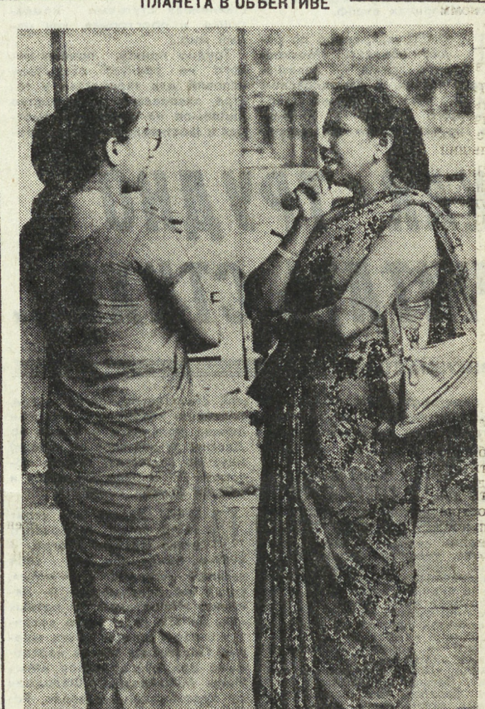
Республика Сингапур расположена на небольшом одноименном острове в водах Малаккского пролива. Выгодное географическое положение, закрытое за двухмиллионной страной, позволяет называться «торговой лавкой» Юго-Восточной Азии. Не имея своих сырьевых ресурсов, Сингапур выполняет функции своеобразного торгового посредника между Индонезией, Малайзией, Филиппинами и Таиландом, а также является главным перевалочным пунктом между европейскими и азиатскими странами.

Совершенно очевидно, что пекинские лидеры не встретили бы со стороны Запада столь благожелательного отношения, если бы Пекин не проводил фактически согласованного с империалистическими силами курса и не одобрял бы их деятельность на международной арене.