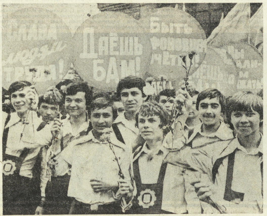
В СТАРИННОМ русском городе-герое Туле, славящемся своими рабочими традициями, состоялась праздничная встреча. В ней приняли участие учащиеся профессионально-технических училищ города и области.

«Плывут по стенам цехов блики огня, грохочут могучие механизмы. Идет очередная смена — идет мужская работа. В. БАСМАНОВ, наш спецкор, Нижний Тагил.