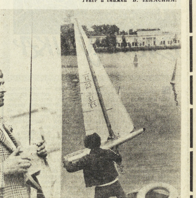
Свердловские прошли соревнования Урало-Восточной зоны РСФСР по судомодельному спорту