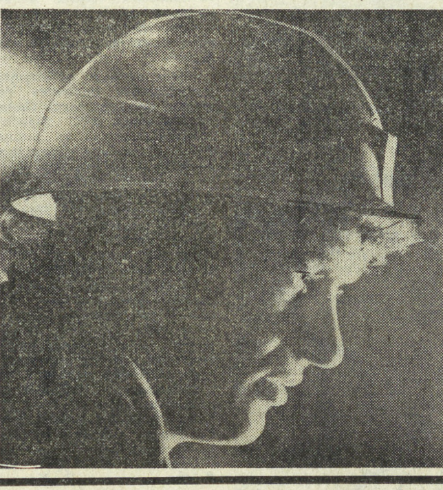
Огонь и металл всегда были мужским делом.

В МАРТЕНОВСКОМ цехе № 1 НТМК имени В. И. Ленина, как и в любом мартеновском цехе, буйствует огонь и металл. Их величественная кирга наполняет собой все. В сплывающем белом пламени, рвущемся из-под заслонок печей, сквозит стремительный танец ярко-красных искр жидкого металла, что льется из громадного ковша — плавят, вздрагивая на стыках рельсов, завалочная машина. Даже люди — их лица, руки — кажутся отлитыми из какого-то удивительного сплава.