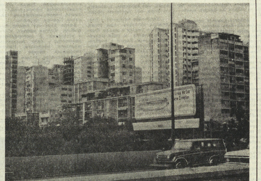
Венецуэлы часто называют свою столицу Карракас «городом без времен года». Зимой и летом, весной и осенью он утопает в зелени. Раскинувшийся амфиатером на отрогах Анд Карракас...