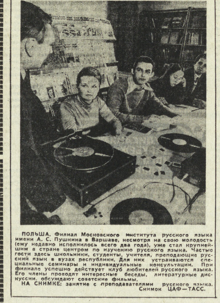
ПОЛЬША. Филмал Московского института русского языка имени А. С. Пушкина в Варшаве, несмотря на свою молодость...