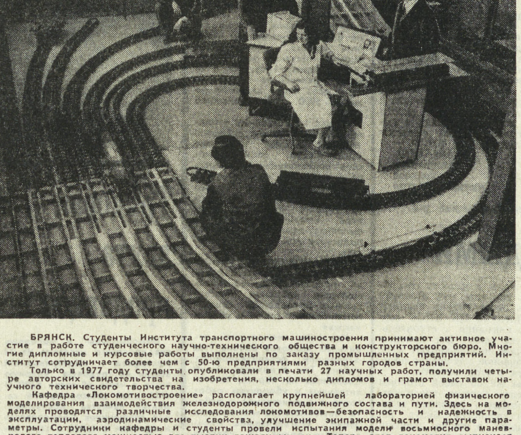
Брянск. Студенты Института транспортного машиностроения принимают активное участие в работе студенческого научно-технического общества и конструкторского бюро. Многие дипломы и курсовые работы выполнены по заказу промышленных предприятий. Институт сотрудничает более чем с 30-ю предприятиями разных городов страны. Только в 1977 году студенты опубликовали в печати 27 научных работ, получили четыре авторских свидетельства на изобретения, несколько дипломов и грамот выставок начального технического творчества. Кафедра «Локомотивостроение» располагает крупнейшей лабораторией физического моделирования взаимодействия железнодорожного подвижного состава и пути. Здесь на модели проводится исследование безопасности и надежности в эксплуатации, аэродинамические свойства, улучшение экипажной части и другие парапараметры. Сотрудники кафедры и студенты провели испытания модели восьмьюосного маневрового тепловоза мощностью более тысячи лошадиных сил. Теперь этот локомотив выпускает для БАМ. Локомотивный тепловозостроительный завод. На снимке: в лаборатории идут исследования локомотивов будущего.

Большое и красочное оформление окна «Комсомольского проектора» на комбинате «Сухоложскэнерго» издали привлекает внимание. Яркие, остро сатирические рисунки в форме «проекторов» в борьбе с недостатками в организации производства. Два года назад задумались комсомольцы комбината о том, как усовершенствовать методы работы своего «КП». Комсомольский проектор должен быть действенным, означать реальную работу, а не формальности. Целевые задания, сигналы — аргументированные, — думали ребята. Они решили, что прежде всего нужно хорошо организовать труд самого штаба «КП». Тогда была организована учеба членов штаба и постов «КП» на заводе. Программа обучения предусматривала работу. Она включает в себя множество разных вопросов: технический, организационный, экономический, производственный, а также идеологические и нравственные проблемы. Юридические консультации о правах «проектористов», по формам обмена информацией между предприятием и населением, о правах «проектористов», о правах «проектористов» и о правах «проектористов». Один из первых совместных рейдов был по подготовке к коммунистическому субботнику