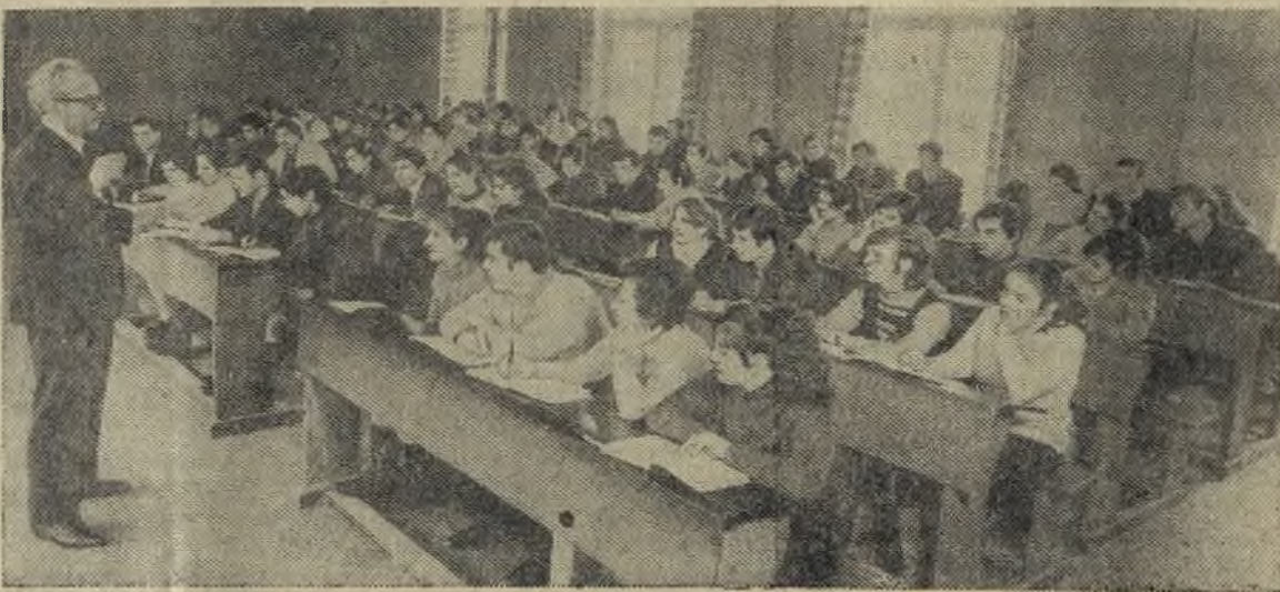
В БРАТСКОЙ СЕМЬЕ НАРОДОВ СССР

Юго-Осетинская автономная область, входящая в состав Грузинской ССР, 20 апреля 1972 года праздновала свое 50-летие.