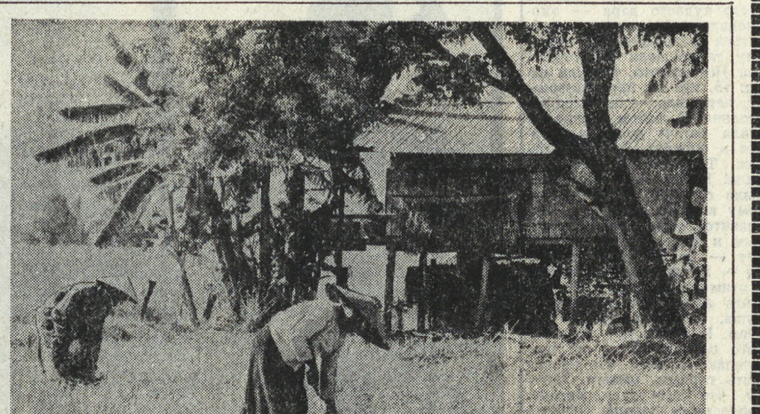
В Лаосской Народно-Демократической Республике идет уборка риса второго урожая. Следя за намеченным правительством курсом на расширение участия сбора двух урожаев в год...