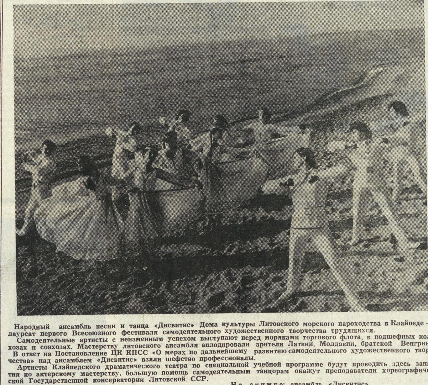
Народный ансамбль песни и танца «Дисвитис» Дома культуры Литовского морского пароходства в Клайпеде — лауреат первого Всесоюзного фестиваля самодеятельного художественного творчества трудящихся.

Этот день недолго запомнится пионерам школы № 48 города Нижнего Тагила. На торжественном сборе «Марат, ты вечен, как народ!» пионерские дружины школы присоединились к пионер-герою Марату Казею. А у свердловчан уже побывали работы из Таллина и Вильянди, Могилева и Минска, Одессы и Кишинева, Йошкар-Олы и Новосибирска. Все коллекции сопровождаются книжками отзывов. Запись обсуждения — обязательна. Потом это станет почетной школой для каждого из участников «Фотоорбиты».