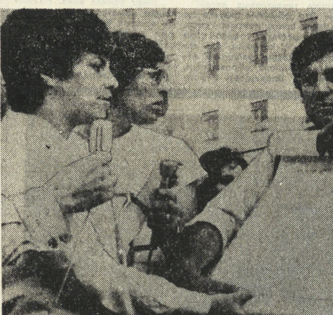
В Израиле ширится движение протеста против экстремистской политики правительства Бегина. Участники движения, проходящего под лозунгом «Мир сегодня», требуют справедливого мирного урегулирования, которое учитывало бы законные права арабских народов. 4 тысячи человек приняли участие в демонстрации, состоявшейся в Иерусалиме. На 20 километров от окранных городов до резиденции израильского премьер-министра прокатилась цепочка манифестантов, из рук в руки передававших петицию, требующую от правительства отказаться от пагубного курса на аннексию оккупированных территорий. Под ней поставили свои подписи 12 тысяч человек. НА СНИМКЕ: участники манифестации в Иерусалиме с петицией протеста.