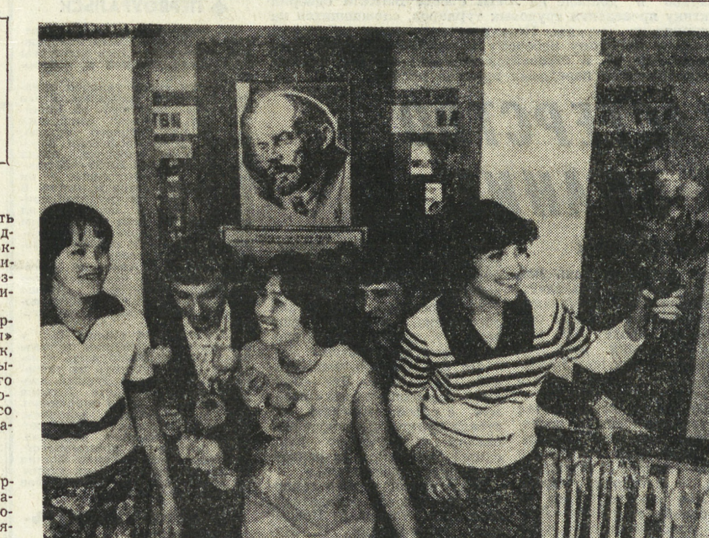
Как боевую программу действия восприняли учащиеся Кустанайского кооперативного техникума. Речь Генерального секретаря ЦК КПСС, Председателя Президиума Верховного Совета СССР товарища Л. И. Брежнева на XVIII съезде ВЛКСМ, в которой было сказано о том, что комсомолу следует взять под свою постоянную и неослабную опеку сферу торговли и обслуживания.

Комсомольцы техникума приняли решение взять шефство над сельскими торговыми предприятиями Наурзумского района и подтянуть качество обслуживания хлебороба целинских совхозов.