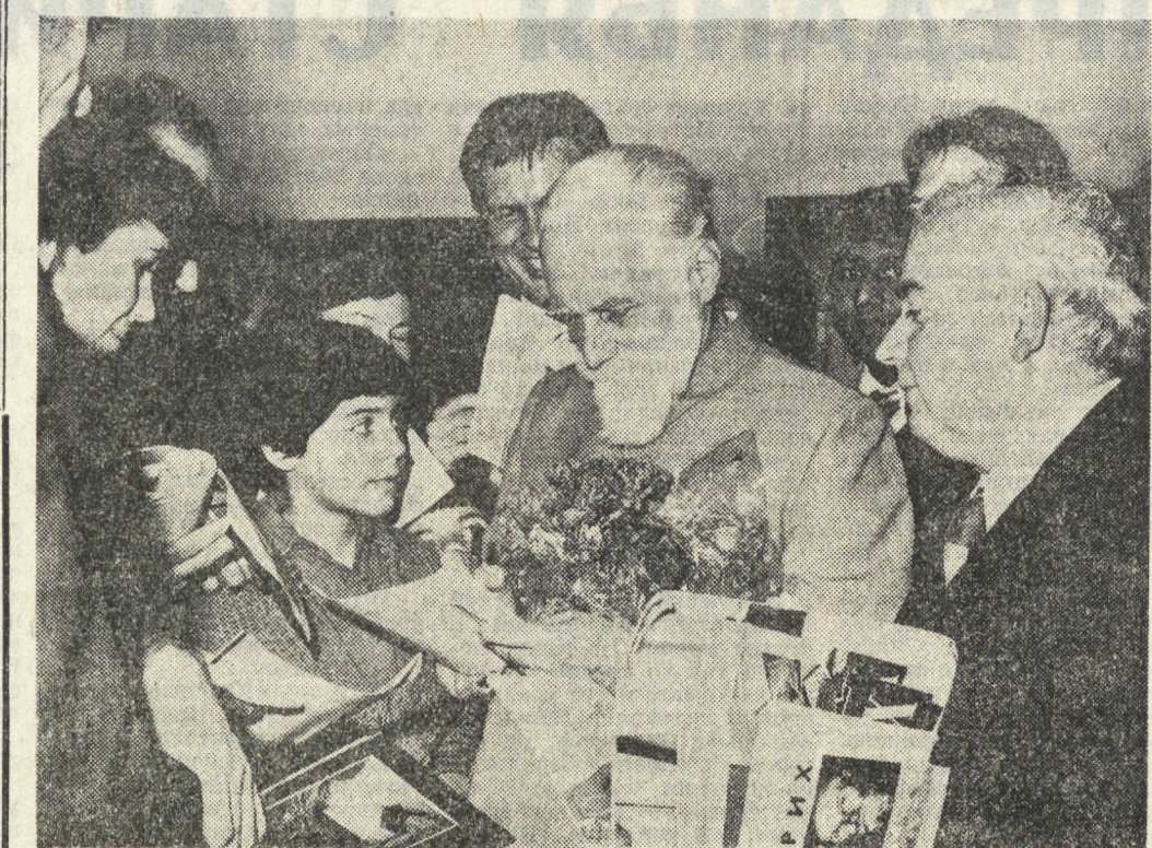
София. Русский художник Светослав Рерик дает автографы. Он посетил Болгарию в связи с открытием выставки его отца, известного русского художника Николая Рерика...