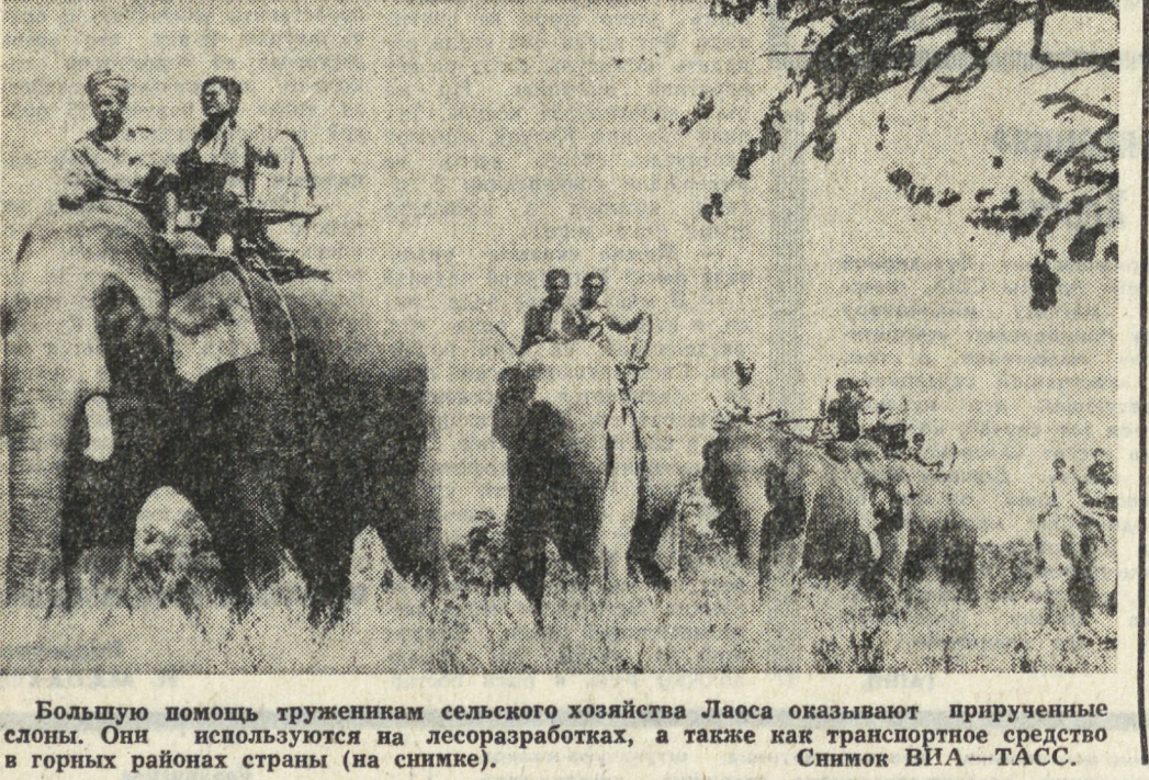
Большую помощь труженикам сельского хозяйства Лаоса оказывают прирученные слоны. Они используются на лесозаготовках, а также как транспортное средство в горных районах страны (на снимке).