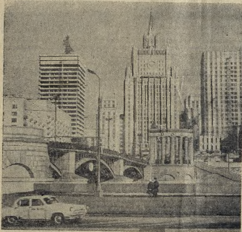
МОСКВА. В столице ведется большое строительство. На снимке: вид со стороны Бережковской набережной на строящийся корпус гостиницы «Интурист» (слева) на Смоленской площади.

М. ТАРАСОВА, начальник пошивочного цеха швейной фабрики.