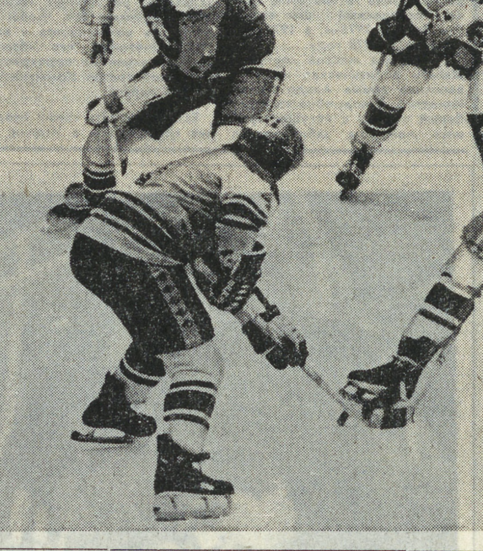
Игроки «Автомобилиста» в игре с командой из другой команды.

Неожиданно в ходе турнира обнаружился изъян, который трудно было предсказать в начале сезона, когда коллектив готовился к предстоящему трудному для себя сезону. Не выдержали испытания люди, которые оказались не на должной высоте в деле создания единого мо- нопольного коллектива, тре-