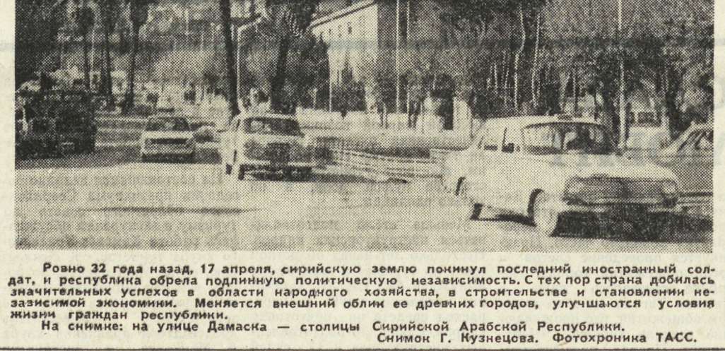
Ровно 32 года назад, 17 апреля, сирийскую землю покинул последний иностранный солдат, и республика обрела подлинную политическую независимость. С тех пор страна добилась значительных успехов в области народного хозяйства, в строительстве и становлении независимой экономики. Меняется внешний облик ее древних городов, улучшаются условия жизни граждан республики.