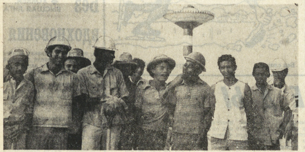
КУБА. Именем XI фестиваля назван отряд молодых строителей, работающих на сооружении крупного комбината доушевен, 363 из них — члены Союза Молодых Коммунистов Кубы...