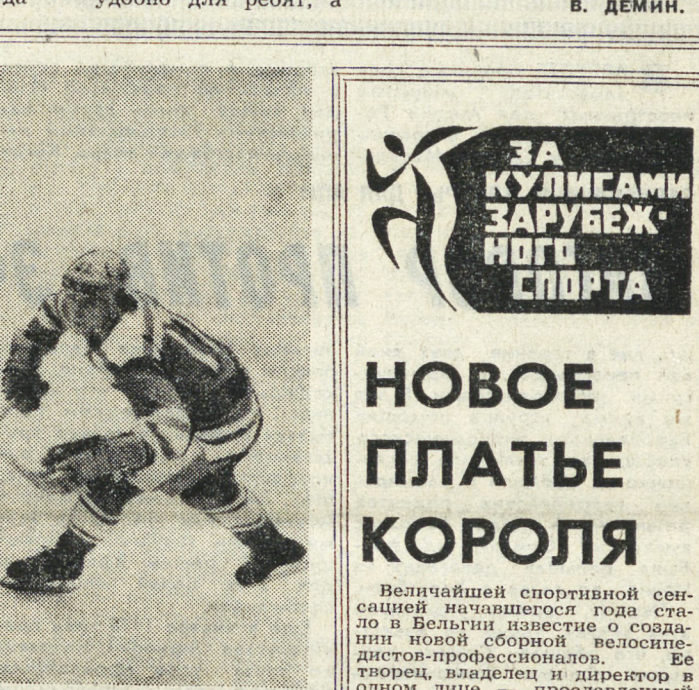
Успехи настоящих спортсменов и команд — пример в подготовке к спартакиадным стартам.