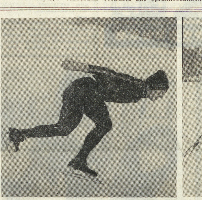
Успехи настоящих спортсменов и команд — пример в подготовке к спартакиадным стартам.