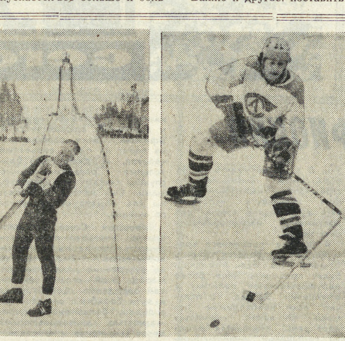
Успехи настоящих спортсменов и команд — пример в подготовке к спартакиадным стартам.