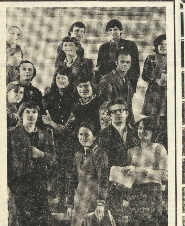
Брянская область. Выпускники Южного совхоза-техникума единогласно одобрили постановление партии и правительства о дополнительных мерах по стимулированию перехода специалистов сельского хозяйства на работу руководителями подразделений среднего звена и вошли пойти работать на самые трудные и ответственные участки производства — зевневскими, помощниками бригадиров, бригадирями.